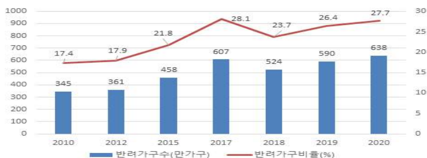
[그림 1] 반려가구 양육가구 현황