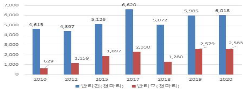
[그림 2] 연도별 반려동물 사육두수