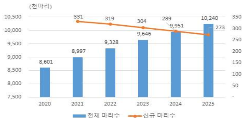
[그림 3] 반려동물 사육 규모 추정 결과